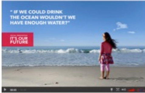
1. Quảng cáo