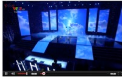
2. Video nội dung