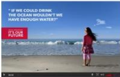
1. Quảng cáo