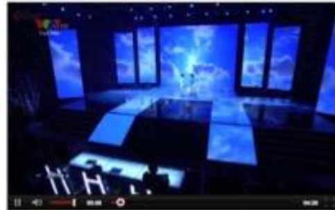
2. Video nội dung